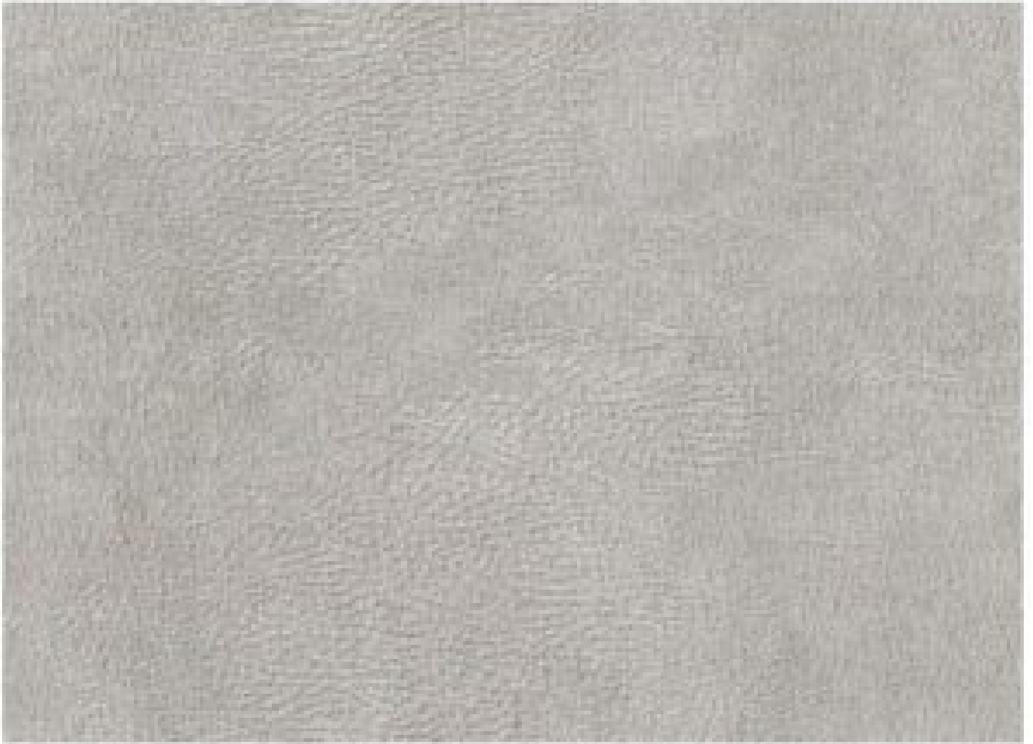
Relax 101 Ivory