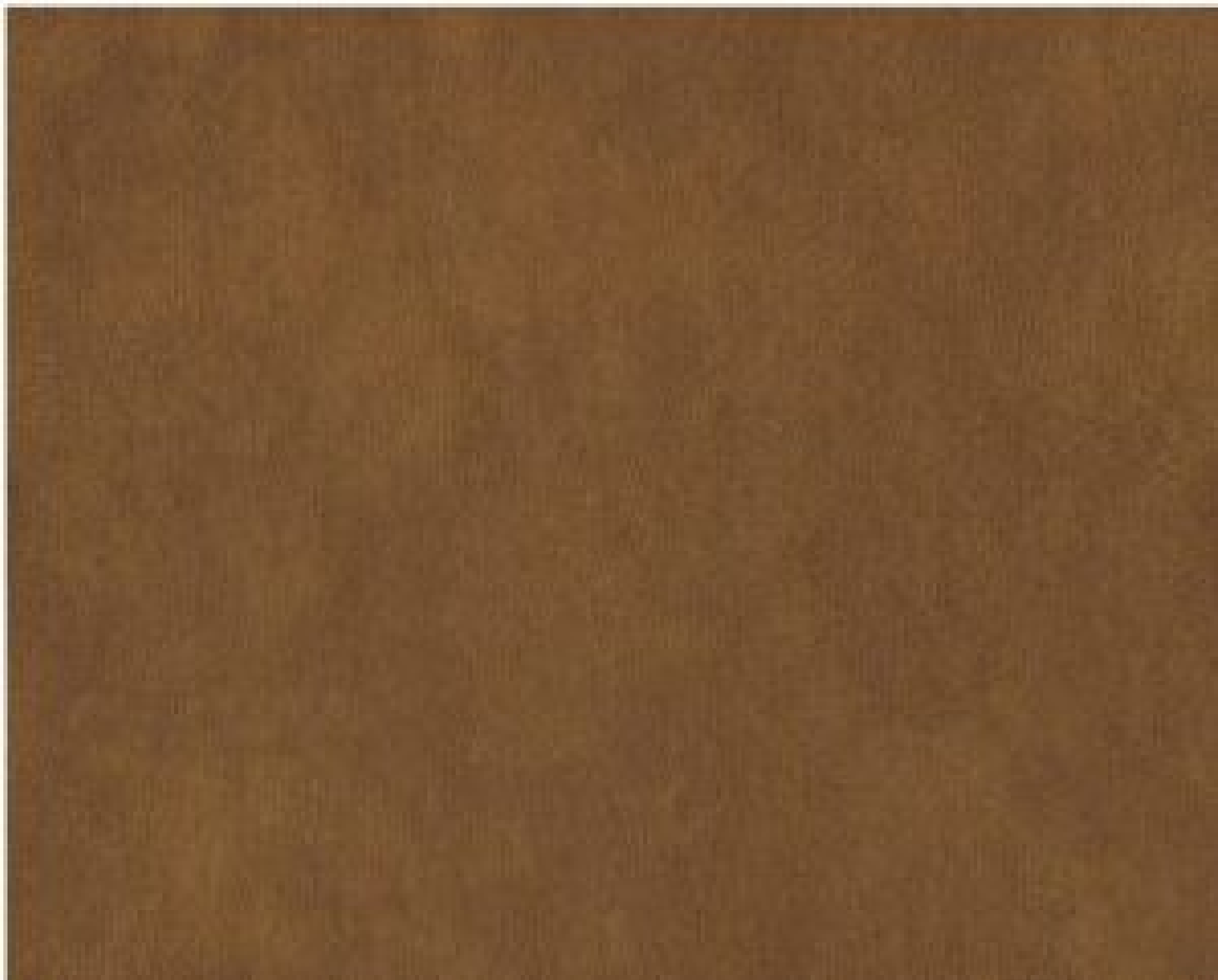
Relax 119 tan