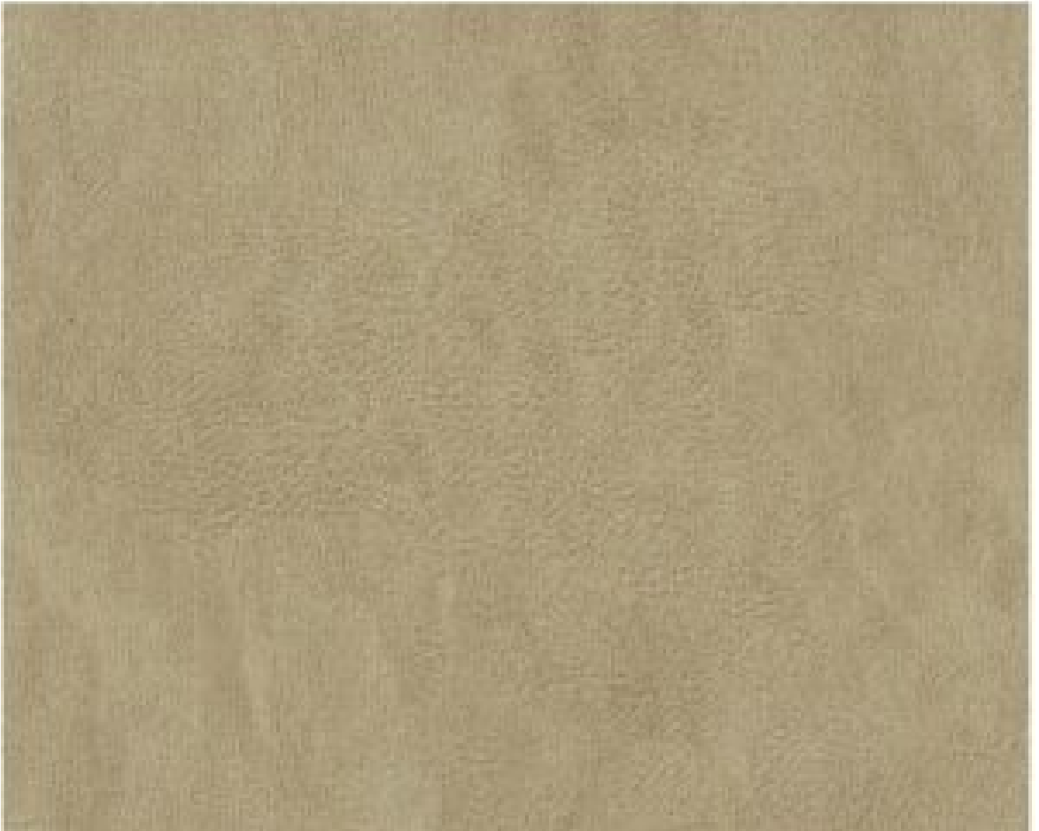
Relax 05 beige